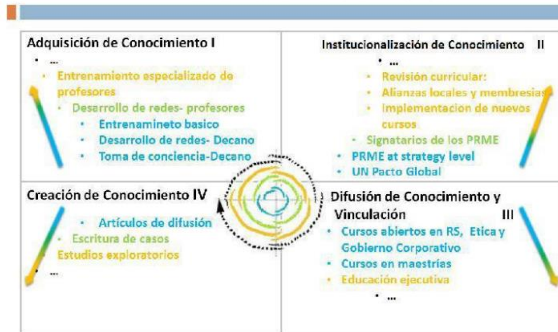
Figura 1. PRME Paso a Paso

Cada grupo de actividades desencadenó un ciclo de conocimiento en espiral que se caracteriza por las siguientes etapas: Adquisición - Institucionalización - Difusión - Creación. Sin embargo, nuestra experiencia nos dice que se pueden producir escenarios simultáneos y que algunas de las actividades pueden ocurrir paralelamente. La metáfora espiral PRME trata de explicar que cada ciclo aumenta nuestro conocimiento, refuerza la institucionalización, involucra a más personas y desarrolla la capacidad de creación de conocimiento. El ser signatarios del PRME ha sido una experiencia de aprendizaje continuo para ESPAE.